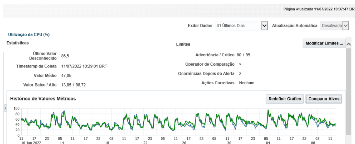
Gráfico extraído da ferramenta OEM, Julho-2022

Conforme já mencionado, os Quarters X3 e X5 contam com 2 nós de processamento cada. No ambiente produção, que conta com somente dois nós de processamento, já não é possível suportar a carga em caso de queda de um dos nós, conforme pode ser observado no gráfico abaixo extraído do OEM em 11/07/2022 para os últimos 30 dias: