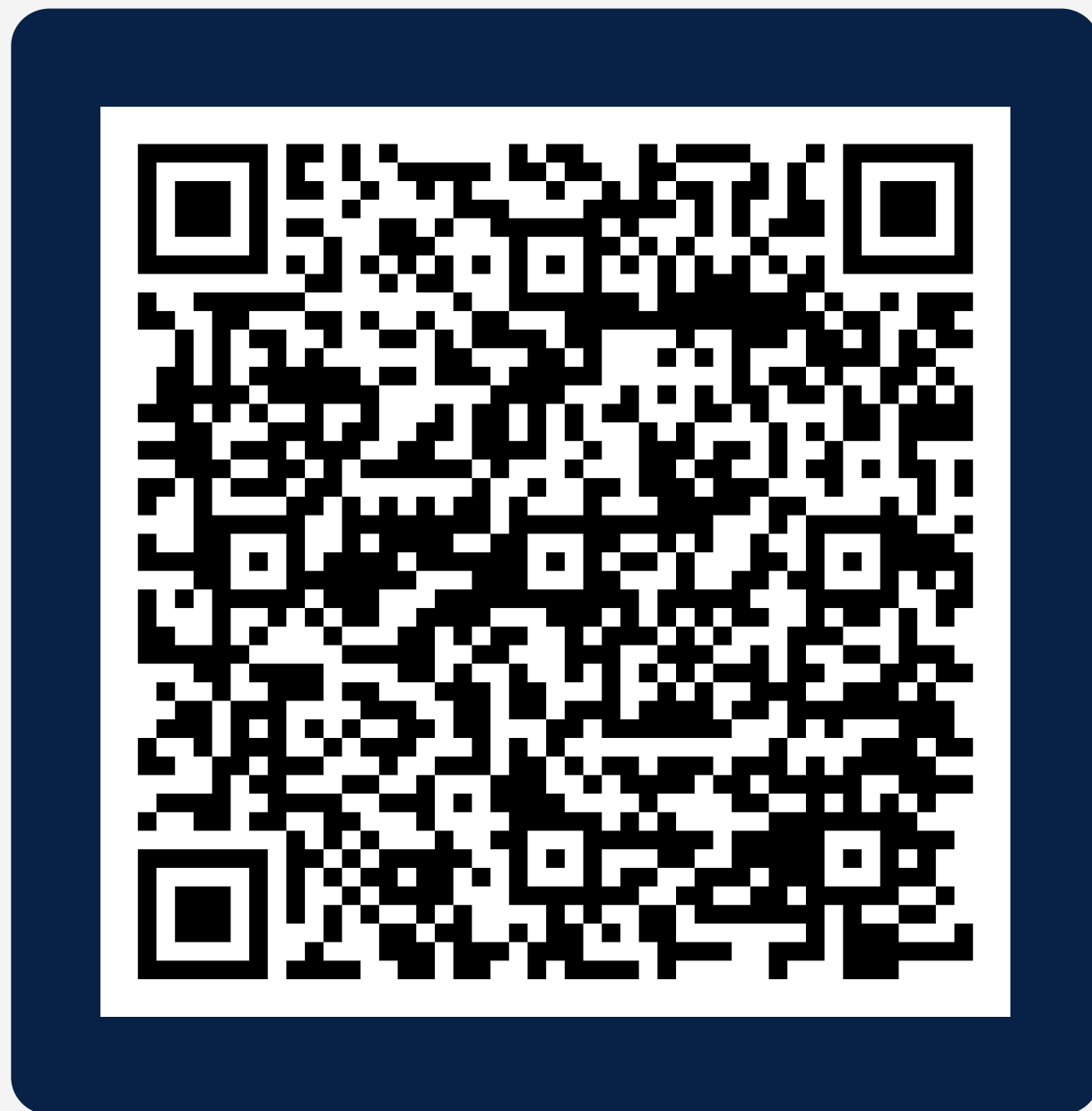
Manual de Tipificação da Despesa Orçamentária