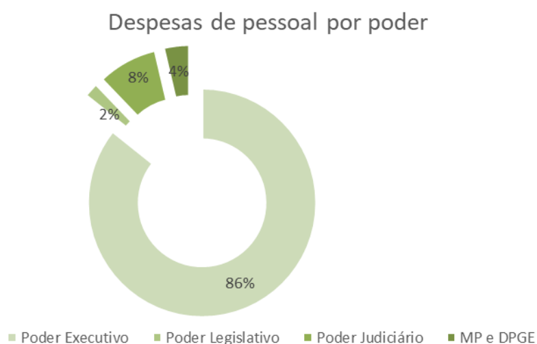
Gráfico 3 – Composição da Despesa de Pessoal por Poder

Obs: Composição desconsiderando a despesa Intra-orçamentária