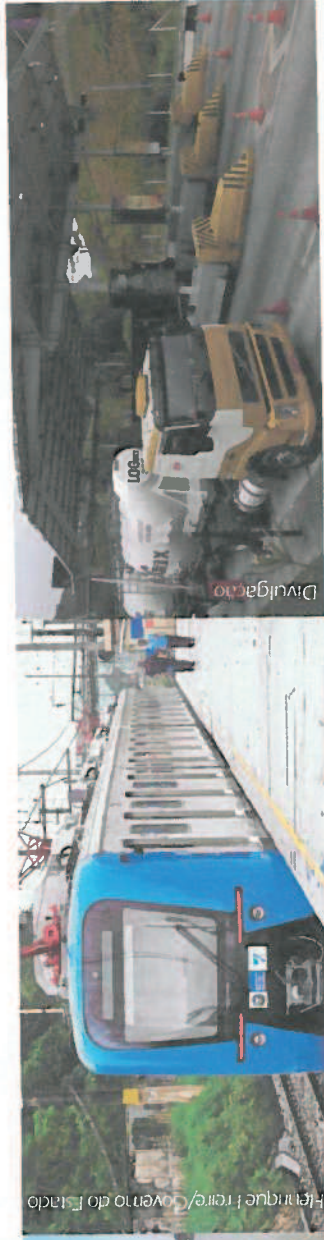
Fernando Ferraz/ Governo do Estado